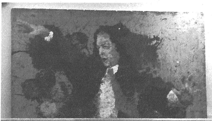
Najťažší a neukradnuteľný obraz