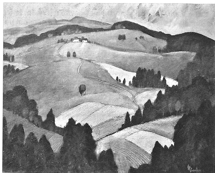
Polia v horách II

- Plenéry majú pre mňa dve hľadané roviny. Tou prvou je získavanie skúseností a získavanie rozhľadu o dianí a čerstvých