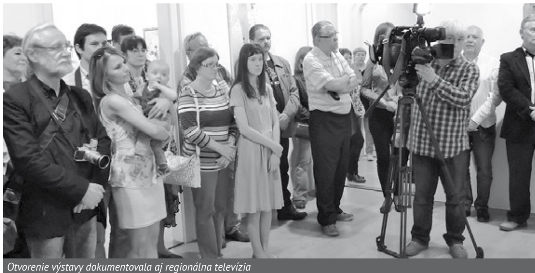
Otvorenie výstavy dokumentovala aj regionálna televízia