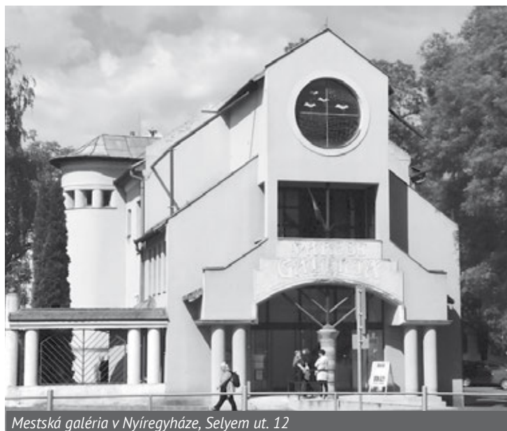
Mestská galéria v Nyíregyháze, Selyem ut. 12

Vo výberovej kolekcii Galérie Átrium sú zastúpení maliari, grafici, sochári a fotografi nielen z Prešova a regiónu, ale aj niektorí zo zahraničných výtvarníkov, ktorí vystavovali v Átriu alebo sa zúčastňovali plenérov, ktoré táto galéria organizovala. Medzi nimi aj umelci z Nyíregyházy a ďalších maďarských miest, ktorým pravidelne patrí v galérii každoročný výstavný januárový termín, spojený s týždňom maďarskej kuchyne v tamojšej reštaurácii. A tak sa na vernisáži stretli nielen zástupcovia vedenia oboch miest (za Prešov dvaja po-