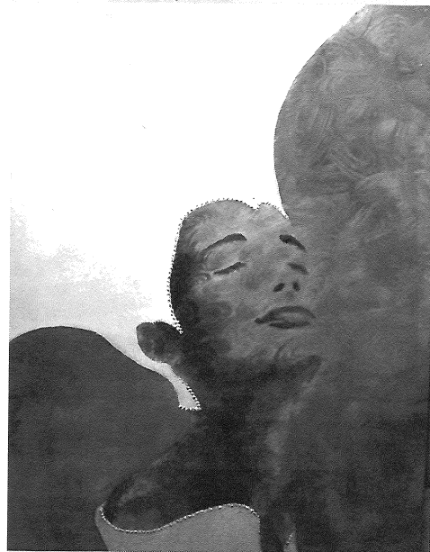
G. Mihálka - Porcelánový mesiac