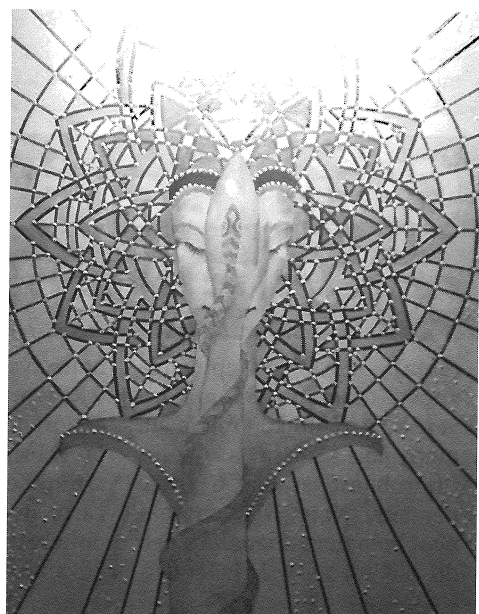
G. Mihálka - Strom poznania